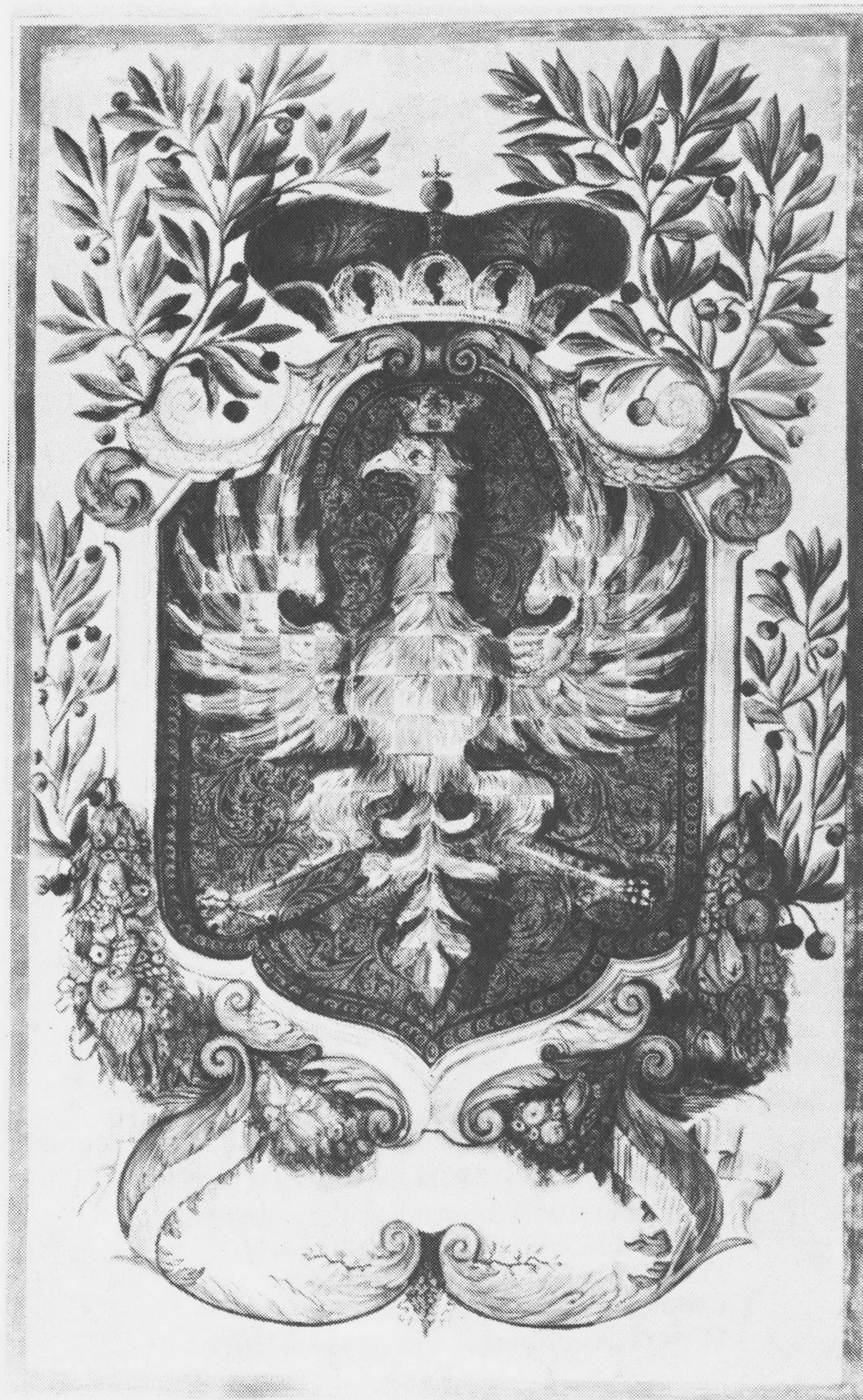
Znak Moravy v Knize stavu panského Markrabství moravského z r. 1670.